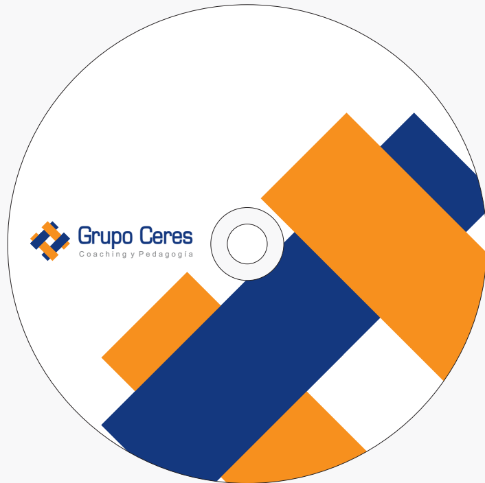
Cover de CD y DVD